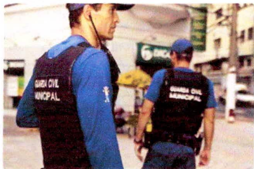
Agentes comunitários de segurança fazem as rondas preventivas na cidade