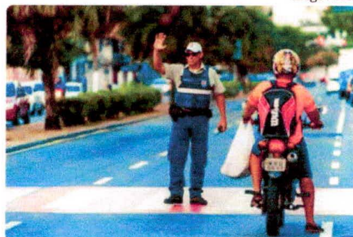
Agentes de trânsito são responsáveis por monitorar o tráfego nas ruas

A Guarda Civil Municipal de Vitória será unificada. Com essa medida, todos os agentes da instituição poderão andar armados e oferecer serviços de segurança à população.