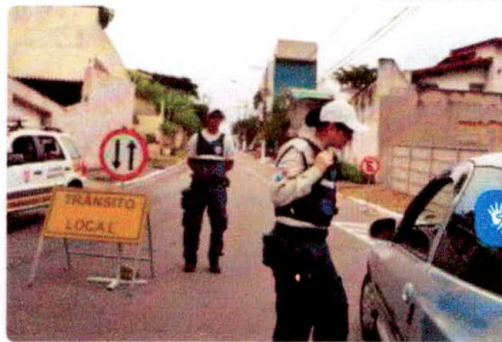
Guardas também terão que fazer cursos de legislação de trânsito