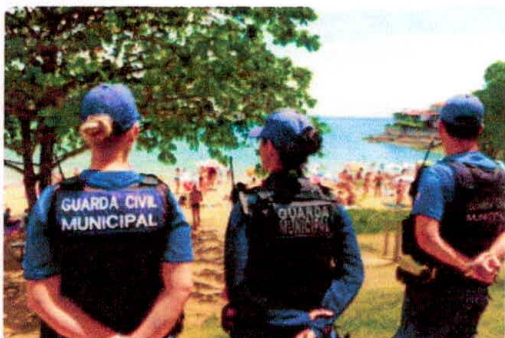
Atualmente, a instituição possui 225 agentes armados