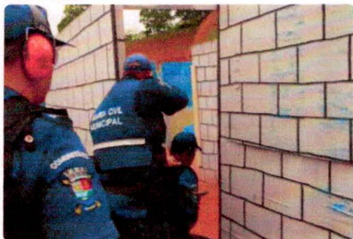
Agentes da Guarda terão de passar por aulas práticas de tiro